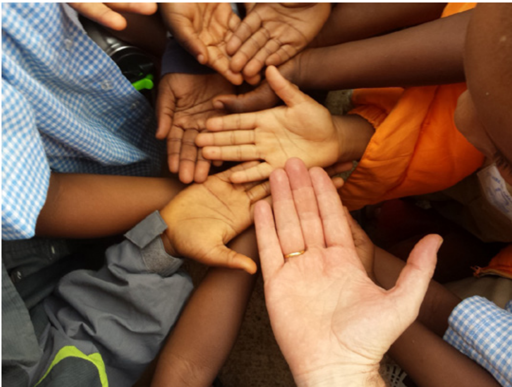
Nens i nenes de Bouaké (Costa d'Ivori) jugant amb voluntaris.

“Tenim dret al joc... però sense perjudicar els altres”