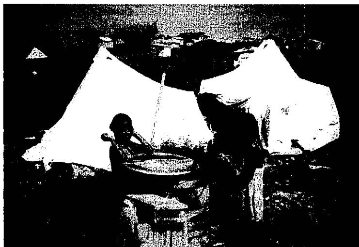
Comentario de la fotografía