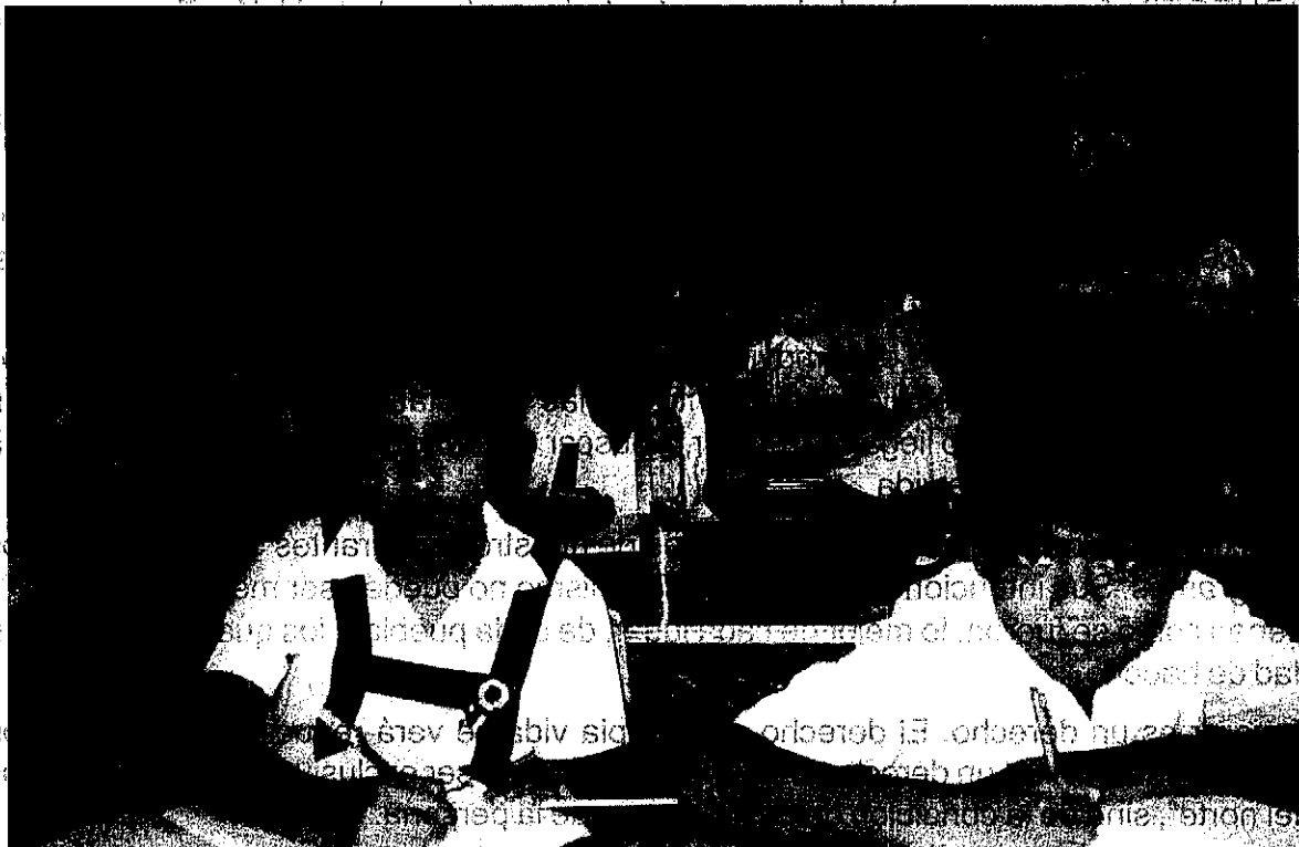
La educación es garantía de futuro